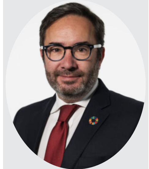
Jorge Moreira da Silva