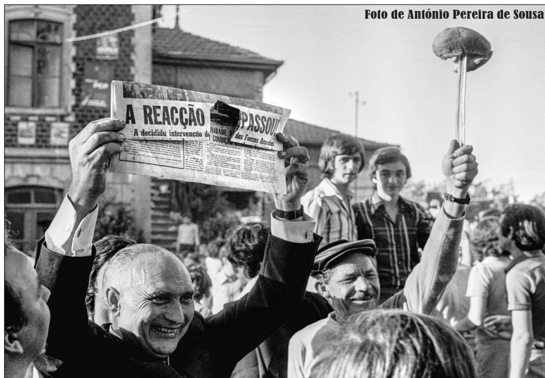
Esta foto vai estar na exposição e é idêntica à que a Associated Press difundiu em agosto de 75, também da autoria de Pereira de Sousa, tendo sido publicada em centenas de jornais por esse mundo fora.

Das “muitas centenas” de fotografias que tirou nesses dias, menos de uma centena nunca foi editada. E dessas foram escolhidas 50 para a exposição, tantas quantas o autor doou à CMV e que a associação mostrará em público pela primeira vez.