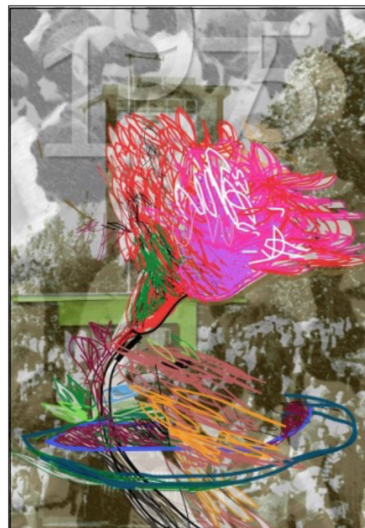
Reprodução da serigrafia criada pelo artista plástico Acácio de Carvalho alusiva aos 50 anos do “Verão Quente” em Famalicão.