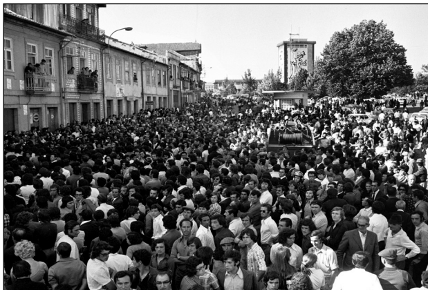
(tirada em Vila Nova de Famalicão em 6 de agosto de 1975)