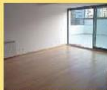
t3 duplex fantast. 122.000 €