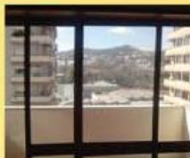
t3 centro 60.000 €