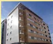
T2 ed. famicasa 92.500 €