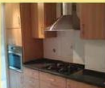
t2 areas boas 84.000 €