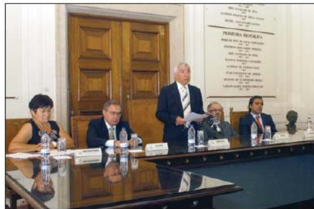
Presidente da Câmara destacou importância dos lusodescendentes para o país

O secretário de Estado das Comunidades Portuguesas lamentou o fluxo "extremamente elevado" de emigração registado nos últimos anos, sublinhando que se trata de um problema para o país, porque "sai muita gente que é precisa cá". "A esperança que nós temos é que estes jovens adquiram novas formações lá fora e que dentro de uns anos haja condições para alguns re-